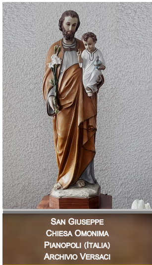
SAN GIUSEPPE CHIESA OMONIMA PIANOPOLI (ITALIA) ARCHIVIO VERSACI