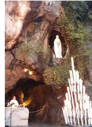
MARIA SS. IMMACOLATA GROTTA DELLE APPARIZIONI LOURDES (FRANCIA) FOTO STABILE

IL MESSAGGIO DEL VANGELO ♦ Periodico religioso N. 28/2024 - Nulla osta per la pubblicazione dei testi: Mons. Tommaso Buccafurni, Ordinario Diocesano di Lamezia Terme. ♦ I testi liturgici sono tratti dal sito web www.chiesacattolica.it © ♦ È un servizio gratuito offerto dalla Associazione "Amici Missionari di Tshikapa" con sede a Serrastretta (Italia), www.associazioneamitshi.it , che ha come fine il sostegno economico della Famiglia Missionaria San Nicodemo con sede a Tshikapa (Repubblica Democratica del Congo). Chiunque volesse, liberamente può aiutare l'Associazione stessa tramite bonifico bancario: Codice IBAN: IT36N 07601 04400 001045477021 * Codice BIC (SWIFT): BPPIITRRXXX, oppure tramite bollettino sul c/c postale N. 001045477021.