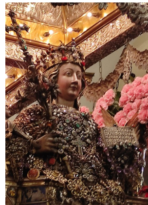
SANT'AGATA PROCESSIONE CITTADINA CATANIA (ITALIA)