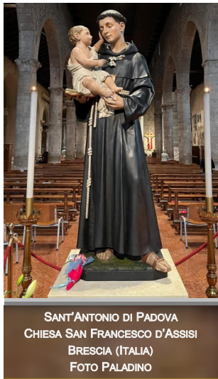
SANT'ANTONIO DI PADOVA CHIESA SAN FRANCESCO D'ASSISI BRESCIA (ITALIA)