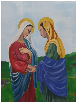
LA VISITAZIONE DI MARIA SS. CASA DI RIPOSO "CARITÀ' ED AMORE" SAN PIETRO APOSTOLO (ITALIA)