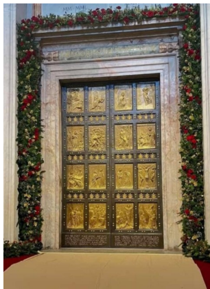
PORTA SANTA BASILICA SAN PIETRO CITTÀ DEL VATICANO