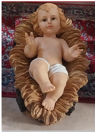
GESÙ BAMBINO SANTUARIO DI DIPODI PIANOPOLI (ITALIA)